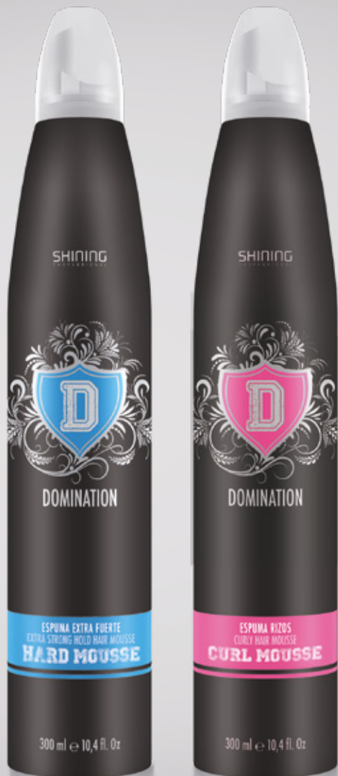
Espuma extra fuerte / Extra Strong Hold Hair Mousse 300 ml

Espuma Extra Fuerte & Espuma cabello rizado Extra Strong Hold Hair Mousse & Curly Hair Mousse