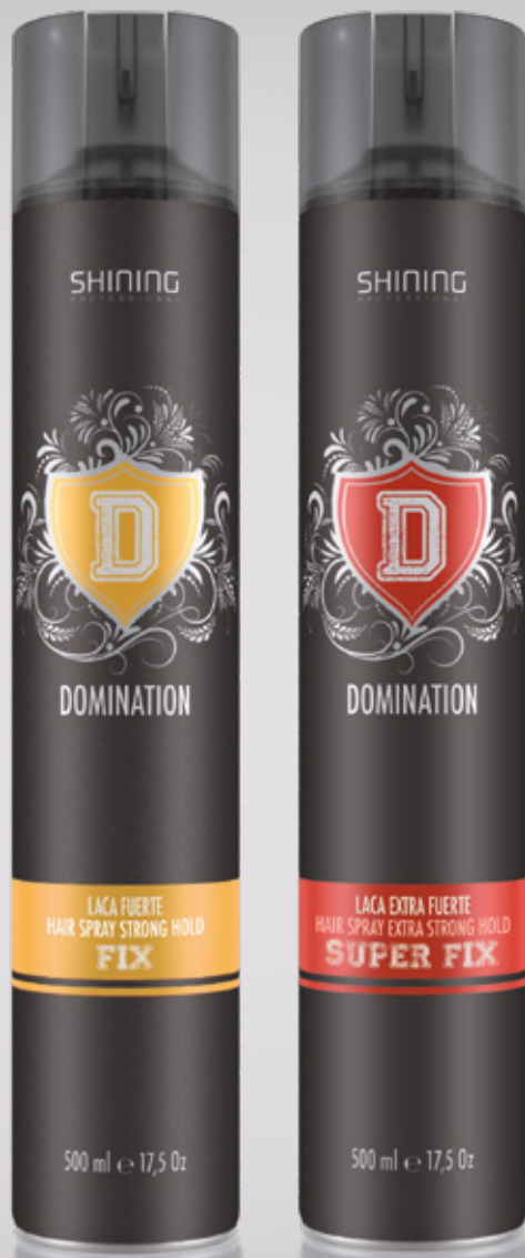
Laca fuerte / Hair Spray Strong Hold 500 ml