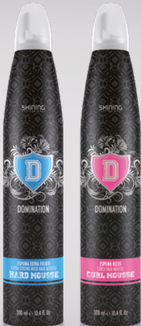
Espuma extra fuerte / Extra Strong Hold Hair Mousse 300 ml

Espuma Extra Fuerte & Espuma cabello rizado Extra Strong Hold Hair Mousse & Curly Hair Mousse