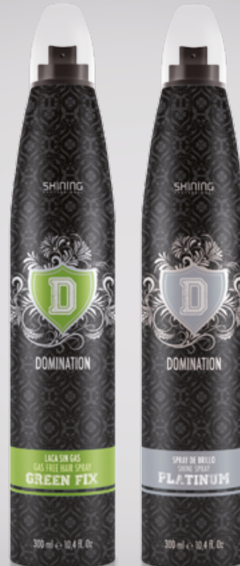
Laca sin gas / Gas Free Hair Spray 300 ml

Laca sin gas & Spray de brillo Gas Free Hair Spray & Shine Spray