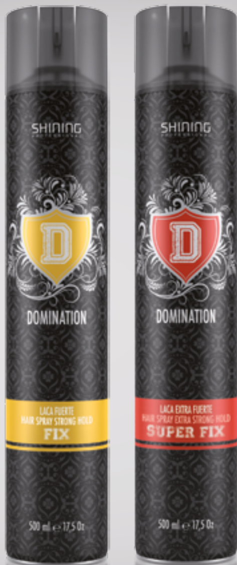
Laca fuerte / Hair Spray Strong Hold 500 ml