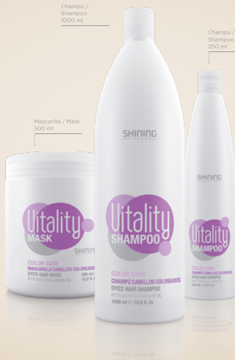
Champú / Shampoo 1000 ml

Champú y mascarilla cabellos teñidos Dyed Hair Shampoo & Mask