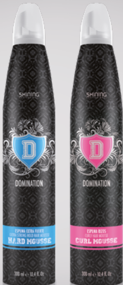
Espuma extra fuerte / Extra Strong Hold Hair Mousse 300 ml

Espuma Extra Fuerte & Espuma cabello rizado Extra Strong Hold Hair Mousse & Curly Hair Mousse